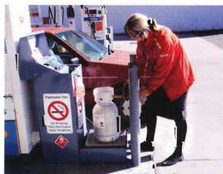
Gasoltankning på bensinmacken, enkelt och billigt. Flaskan ställs på en våg och man betalar för det man tankat. Ca 100 SEK för att fylla en P6:a