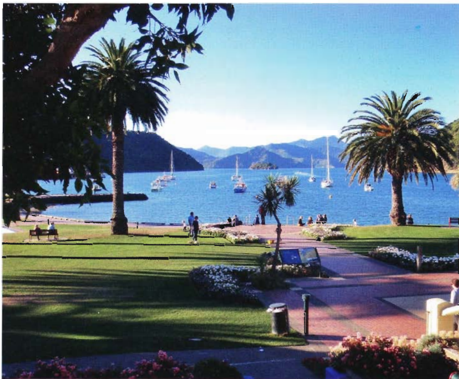
Oftast ankrar man på svaj i någon skyddad vik

Gasol är en sak som är betydligt enklare