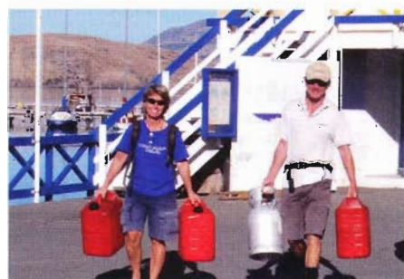
Det finns inga sjömackar, så allt får bäras och släpas