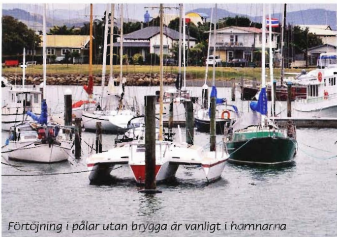
Förtöjning i pälår utan brygga är vanligt i hamnarna

Gå gärna in på Lindisfarnes snygga och omfattande hemsida http://www.sailaround.info/ om ni vill läsa mer om deras seglingar, titta på fina naturbilder eller veta mer om båt och utrustning.