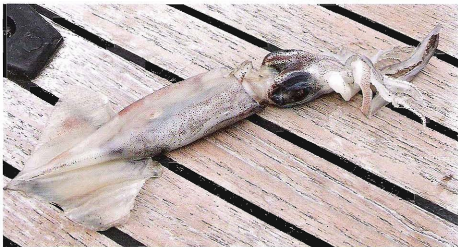
Squid, en vanlig fripassagerare på horisontsegling.

Annan natur, andra människor, och andra sätt att leva, men också en massa andra sjö-