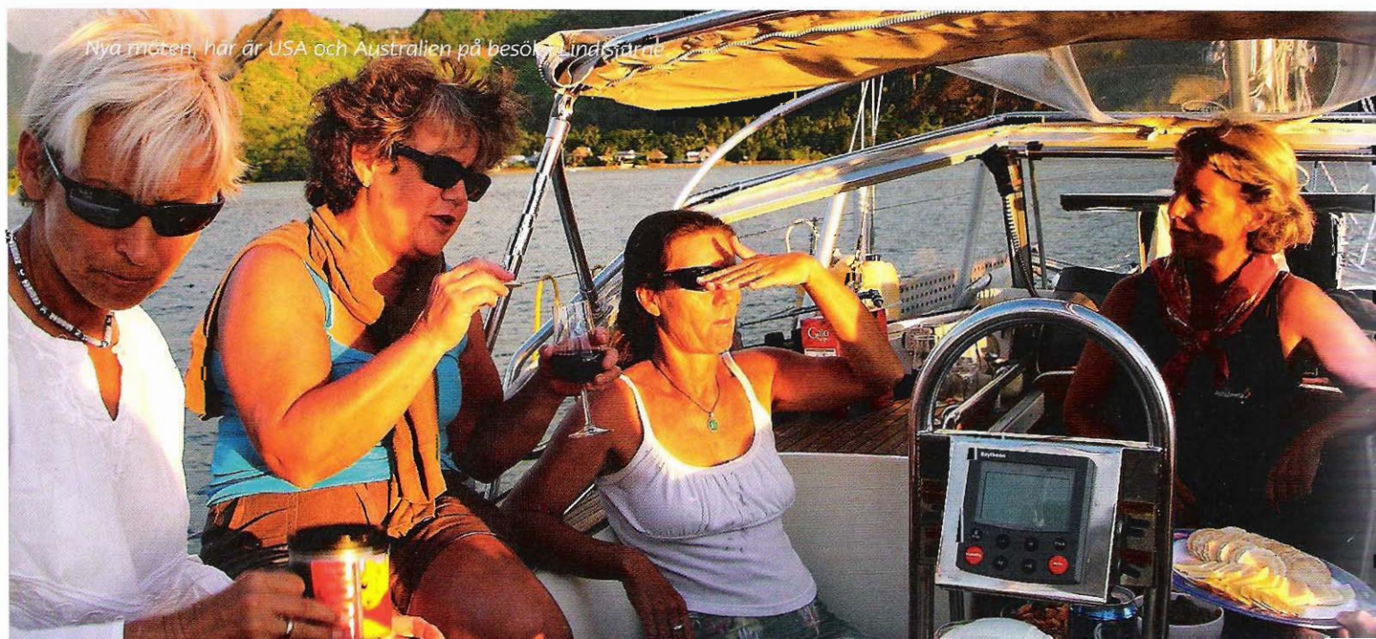
Nya möten, här är USA och Australien på besök. Lindsfjärne

Det som hände när vi kom till Porto Santo beskriver på ett bra sätt ett steg över trös-