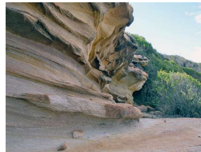
Vindslipad sandsten i naturreservatet i Port Hacking

På juldagen, efter en lugn kryss i sex timmar, baxade vi in oss i ostkustens förmodligen minsta vik, Whaler's Cove, och band upp oss med fyra landlinor plus ankaret väl nerdraget på 8