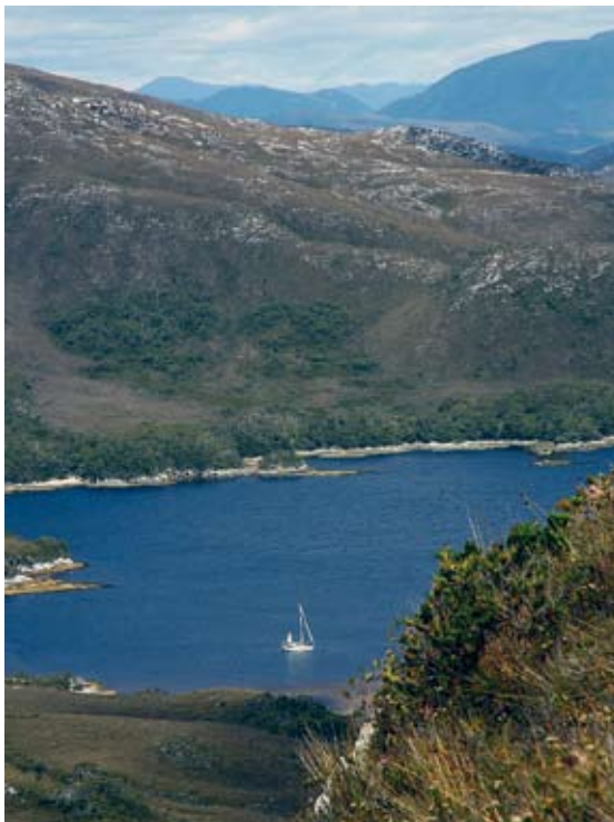
Port Davey är ett naturligt innanhav/fjord med en rätt komplicerad angöring mellan öar och skär.

Vid elvatiden lättade vi ankar och motorseglade i den svaga vinden mot skyddade vatten i öster. Sen eftermiddag kom västvinden och gav oss en rejäl skjuts. Strax hade vi drygt 15 m/s över båten i ren läns. Vid sjutiden närmade vi oss sydosthörnet och hoppades