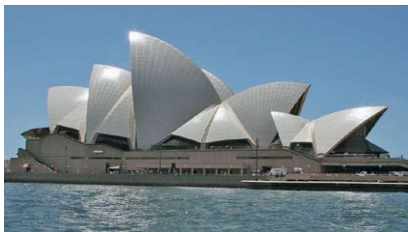
Operahuset i Sydney

Direkt efter tullklareringen gick vi via operahuset till Black Wattle, en gratis och mycket skyddad ankrings-