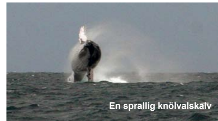
En sprallig knövalskalv

Efter att vi lämnat av Mimmi blev vi kvar i Nuku'alofa några dagar i väntan på bra väder för att segla tillbaka norrut till Ha'apai. Andra natten i Nuku'alofas hamn fick vi besök av en råtta (!) som spatsrat över till båten på en femton meter lång förtöjningslina. 20 timmar senare hade vi fångat in den stackarn och förpassat den överbord. Normala träråttfällor fungerade inte alls. Lösningen blev ett kartonggark med superkladdigt lim och en tomatbit. Rätten låg helt fastkletad