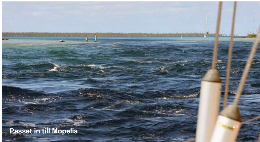
Passet in till Mopelia

Vinden stod sig fint till sista dygnet då den på morgonen dog helt. Motor hela dagen för att till kvällen kunna segla bidevind till halv vind i sex knop i en svag vind med obetydlig sjö, ett förhållande som otroligt nog stod sig hela natten tills vi precis när fullmånen gick ner och solen gjorde sig påmind tog en boj i bukten utanför byn/huvudstaden Alofi på Niue den 15 augusti. Bojar är det enda vettiga