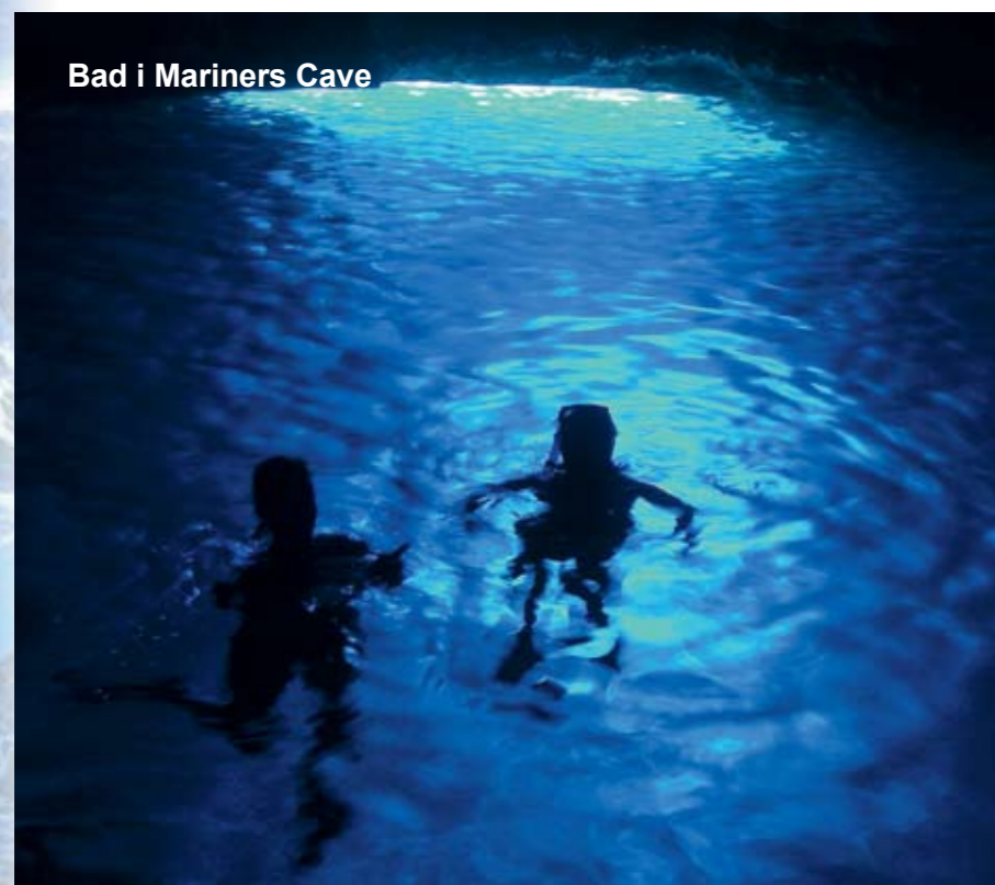
Bad i Mariners Cave