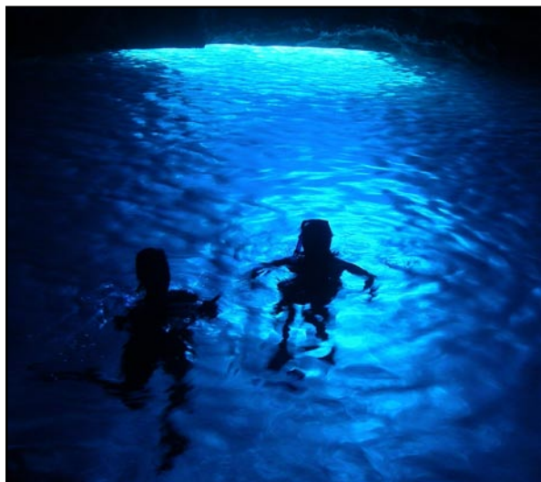
Bad i Mariner's Cave