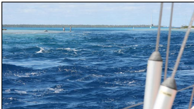
Passet in till Mopelia

Nåväl, har man slagit in på E4:an så får man väl skylla sig själv. Det blev efter en vecka tommare och tommare och sista dagarna var vi bara fyra båtar. Suwarrow har, jämfört med de atoller vi besökt tidigare, väldigt lite att