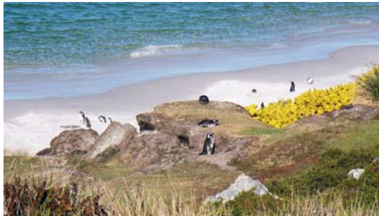
Magellanpingviner på Falklandsöarna

Tiden i Brasilien blev mycket trevlig med utflykter in i Amazo-