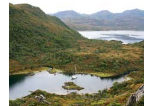
Ankerade i Chiles skärgård