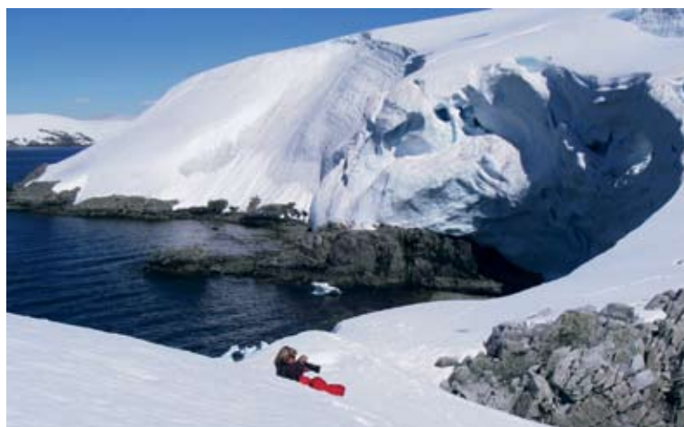
Allt vi tog med oss från Antarktis var bilder

Sen bar det iväg söderut efter Brasiliens kust i medvind. Rio angjordes i fullmåne. Uruguay och Argentina besöktes i oktober 2006. Trevliga och