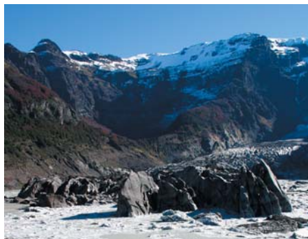
Tronador's svarta glaciär

kan belysas av att passpolisen ansåg att vi var en dag över tiden. Efter att vi påpekat att februari bara har 28 dagar gav dom tveksamt med sig!