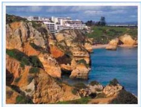
Algarvekusten vid Lagos i januari

3:a kvartalet på långsegling med Lindisfarne, Vinteride i Lagos, Portugal.