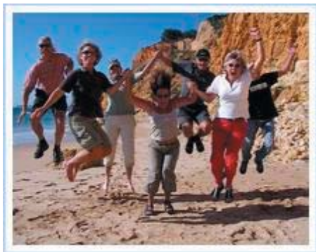
Ett gäng tossiga skandinaver