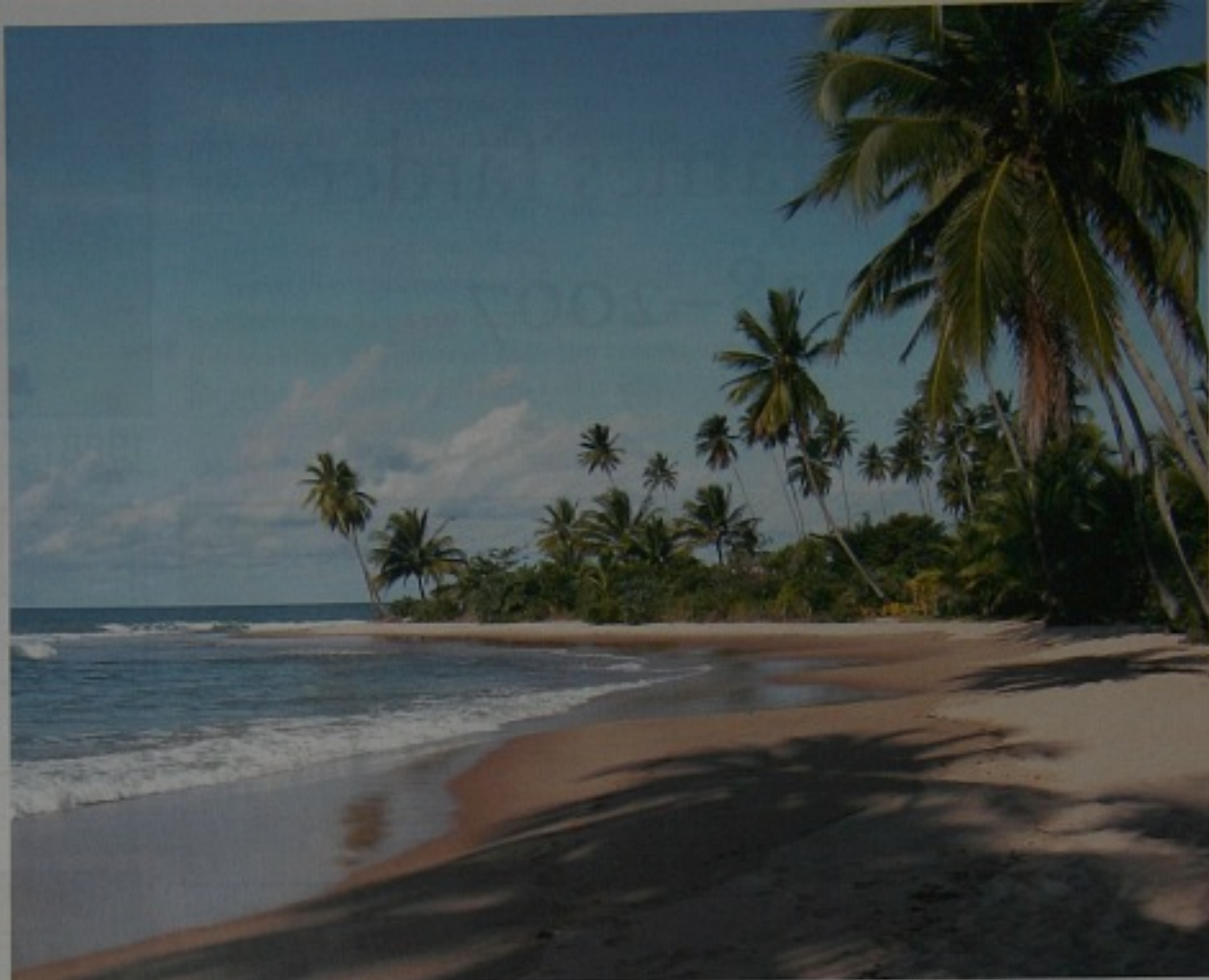
Brasilianska kusten har många fina stränder.

var gynnsamt men efter hand gjorde sig den första av årets höststormar påmind. Cirka 100 nm från Island fann vi att detta inte var rätt rutt och rätt årstid. Grönland skall nog helst nås i medvind från Kanada, och med vår flexibla resplan skulle en sådan segling kunna förverkligas om några år.