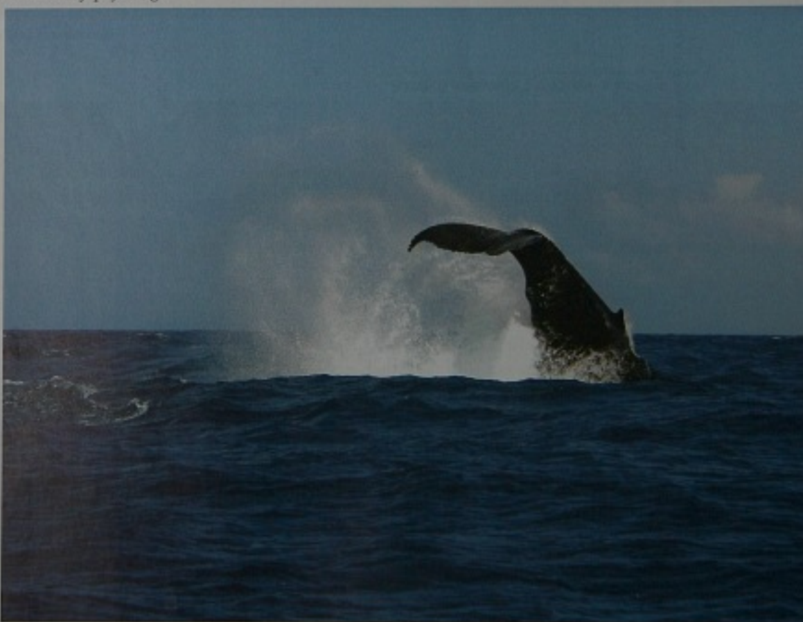
Knölval i djupdykning.