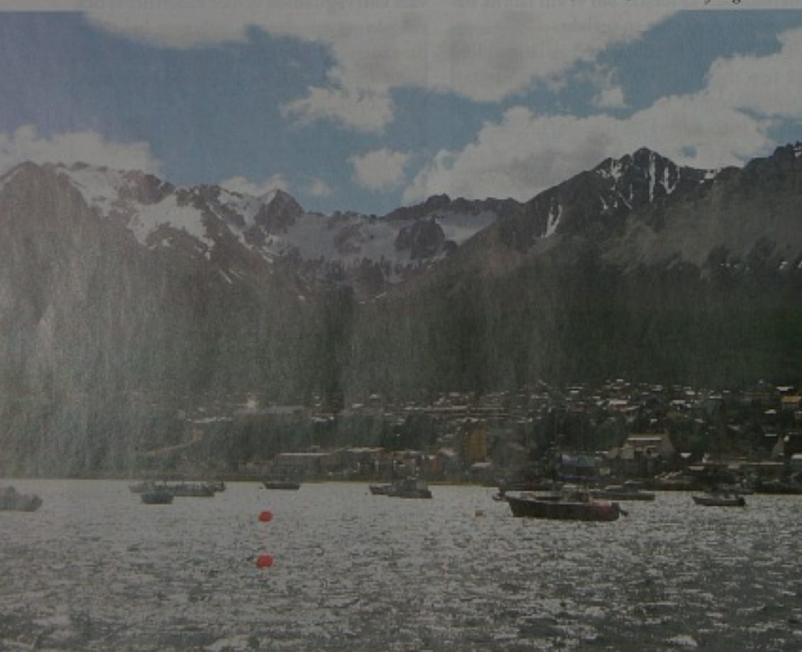
Ushuaia, världens sydligaste stad.

Eldlandet, ett sund lika beryktat som Penland norr om Skottland.