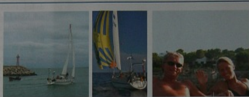
Lindisfärne är en Forgius 37. Hon är byggd 1995 i Henån på Orust.

Tyvårr ligger priserna i yachtklubbar och marinor numera på europeisk nivå. Det är inte ovanligt med priser på 200–300 kronor för en natt. Men vem vill ligga i en marina? Det är egentligen bara säkerhetsaspekten i storstäderna som gör att vi ibland använder