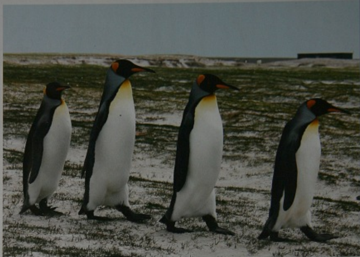
Kungspingviner vid Volunteer Point, Falklandsöarna.

Januari 2007 S/Y Lindisfarne www.sailaround.info