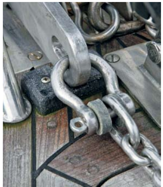
Fäst ankaret till kättingen

Bogbeslag och rullar är sällan (eller aldrig!) dimensionerade för de ryck som ofta blir fallet när man är strax över ankaret. Eftersom man hämtar hem slacket på kättingen successivt är kättingen sträckt till ankaret. Har man då inte bromsen på spelet "lite lös" och dyningen lyfter båten så uppstår stora plötsliga krafter. I detta läge finns det ingen annan "fjädring" i den stumma kättingen än det slirande ankarspelet eller förstörda bogbeslag.