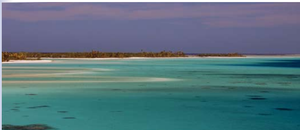
Atoll Tahanea vy åt sydväst