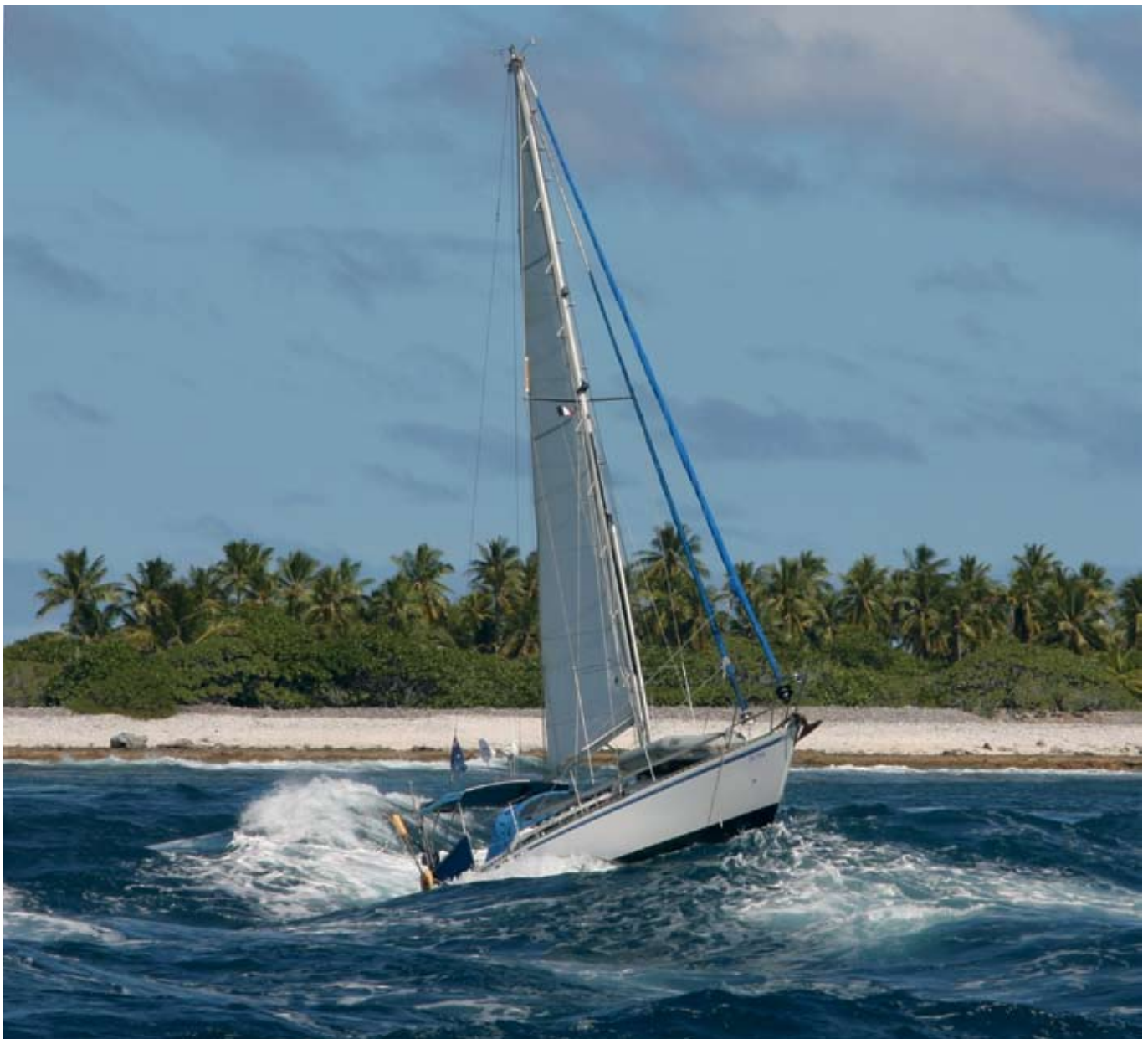
Passet ut genom Hao Oceansegelaren 2-2008

Tahanea, en stor obebodd atoll kom att bli vår favorit. Passet lätt och brett, bra ankringsplatser även om en del innebar korallankring (mer om korallankring på vår websida), kristallklart vatten och gott om stora fiskar. Tahanea är naturreservat vilket bl.a. innebär att man inte yrkesfiskar i atollen, varför fiskarna hinner växa sig stora. Fakarava, en av de största atollerna med ett pass i norr och ett pass i söder. Merparten av båtar, som besöker Fakarava, går genom det norra stora och djupa passet till byn i norra änden. Vi struntade i detta och gick in i atollen genom sydpasset och ankrade strax innanför för att snorkla i det omtalade passet. Fantastiskt klart vatten, botten helt täckt