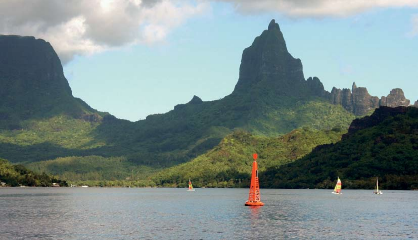
Hajtanden i Opunohu Bay, Moorea

Tahiti, och naturen är alltid väldigt nära. En oerhört vacker ö med fina stränder, höga berg och en fantastiskt frodig växtlighet. Här stannade vi en dryg vecka och hann med både bilrundtur, polynesisk dans på Bali Hai, simma med stingrockor och en massa sociala aktiviteter med andra yachtsisar. En kväll var vi fyra amerikaner, fyra australiensare och vi två svenskar i Lindisfarnes sittbrunn! Livet har i det avseendet ändrat sig totalt. Vi, som varit vana att leva ensamma i månader, har nu hela tiden kontakt med flera besättningar, bland de många svenska. Vi är för tillfället 8 svenska båtar i Polynesien, varav vid ett tillfälle 6 var samti-